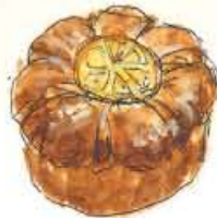
▲オレンジクローヌ